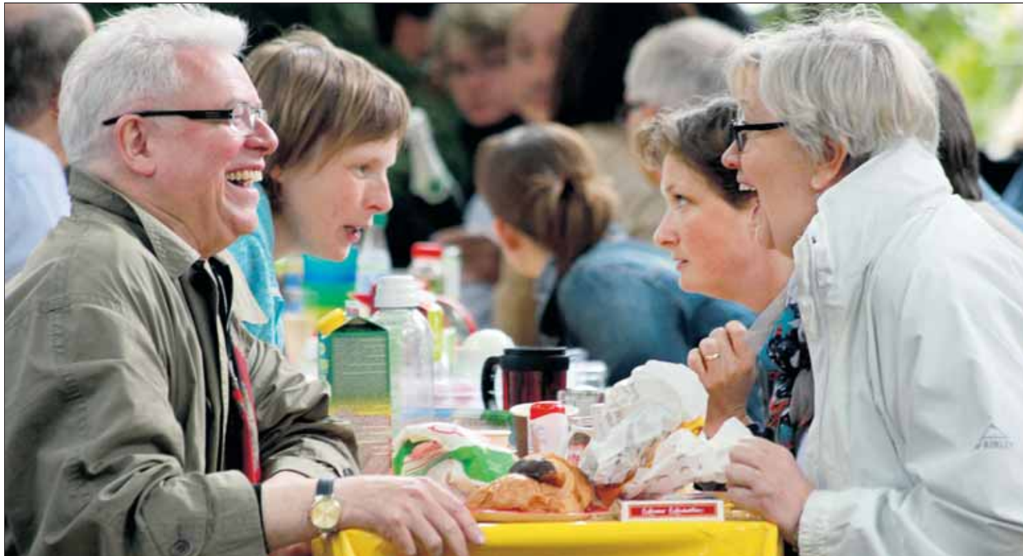
Fröhlich sein, ungezwungen schnackeln und relaxed brunchen – diese Mischung kommt an beim Goslarer Bürgermahl längs des Abzuchtufers.